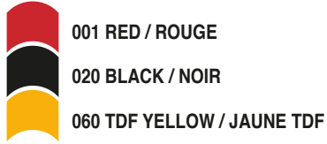
RIGHT SIDE PANEL / BANDE DE CÔTÉ DROITE