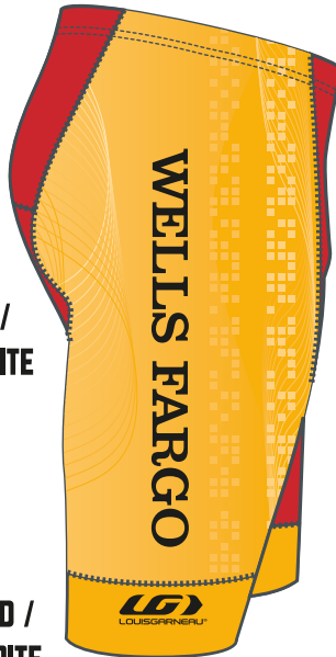
RIGHT POWER BAND / BANDE OURLET DROITE